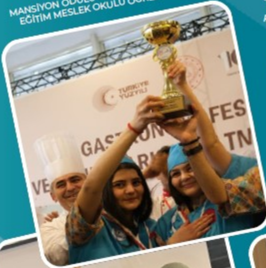
MEB GASTRONOMİ FESTİVALİ VE YEMEK YARIŞMASI MANSİYON ÖDÜLÜ KONYA KARATAY ÖZEL EĞİTİM MESLEK OKULU ÖĞRENCİLERİ